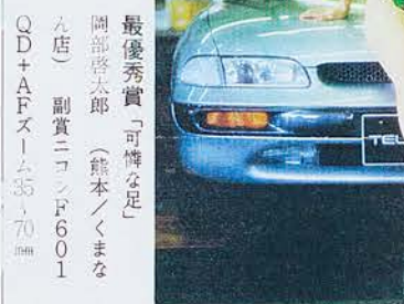
最優秀賞 「可憐な足」 岡部啓太郎 (熊本/くまな ろ店) 副賞ニコンF601 QD+AFズーム35-70mm