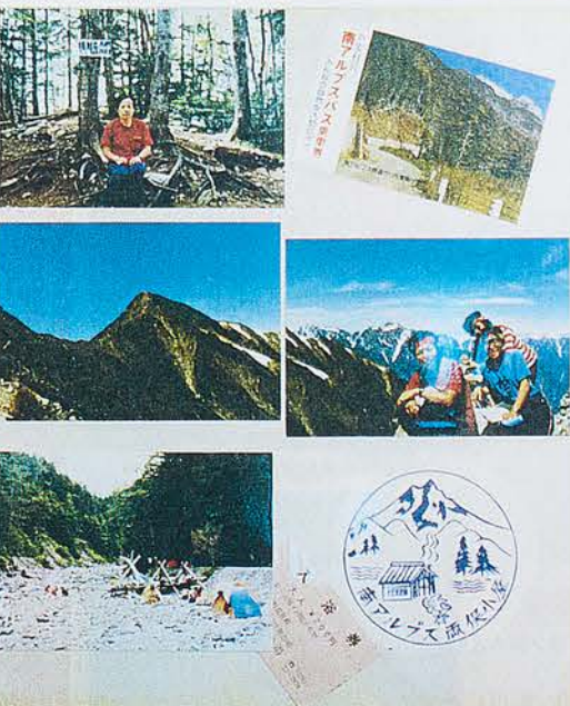
①旅行に出掛けたら入浴券、落

高湯多湿を嫌います。できればネガアルバムを購入をお勧めします。撮影年月日、場所を記入しておかないと、分からなくなってしまう。*