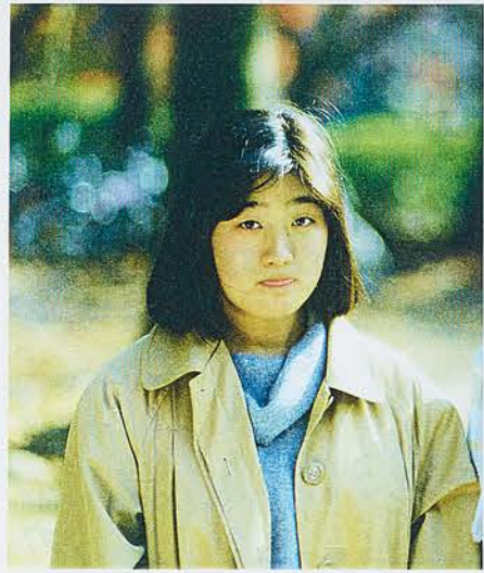
上の写真はバックをボカすために絞り値をF1.8に設定、下はF16。いずれも絞りを優先AEで撮影。

シャッター速度1/60秒で、動きに合せ、カメラを動かしています。背景が流れて見えます。