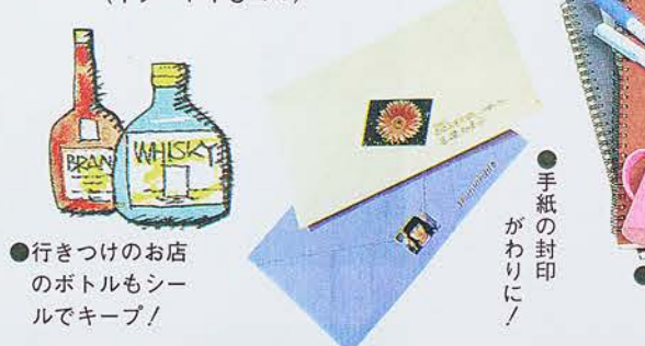
●行きつけのお店のボトルもシールでキープ! ●手紙の封印がわりに!

に、幼稚園に入園したばかりの子供がおつての、持ち物すべてにシールを貼っていた。お母さんによると「写真だからこの持ち物は誰のものか、皆が分かるので取り合っても構わず仲良くできた」と話してくれていたものであるナ。 業務用に 名刺に自分の売りたい商品の写真を貼るのも効果があるようじゃナ。印刷するほどでもないといった時に、シールだから貼る必要がない、貼りにくいとその時と場所を選べるのも便利である。ほかにも使い方は無限にあります。アイデアはあなた次第である。