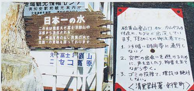
看板もアルバムを飾る材料です。