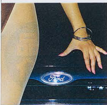
オートラマ賞 「フォードと女」 大石 光 (金沢/有松店)