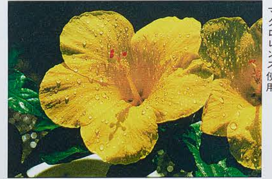
マクロレンズ使用

ツシは、ある娘っ子の前に行く、つい赤面してしまつて話もくすくすできないのだが、200mmレンズで「望遠」という手があるので写真だけは、たくさん持っています。