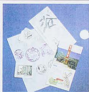
パンフレット、おはしの袋などは印象深くなります。

①撮った写真を全て貼る必要はありません。保存しておく写真、不要な写真を選びます。 ②写真を並べるだけでなく、切り抜いたり、つなぎ合わせたりすると、新鮮味が出ます。 ③時間がたっぷりあるようでしたら、貴方のセンスを活かして週刊誌のグラフィックにするのも一興でしょう。文章を付けると楽しいものになります。